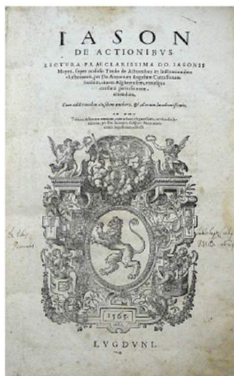
Iason Mayno - De Actionibus